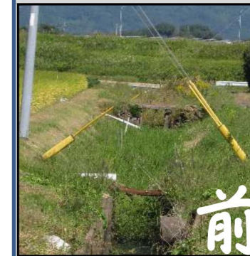
施設の長寿命化(計画①)素掘り水路⇒コンクリート水路