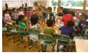
雨の昼休み、クラスみんなで遊ぶ2年生 9/30

教室では学期末を迎えて、この1学期に頑張ったことや成長したこと、今一歩頑張ればよかったなと思うことなど、2学期に繋げるために学習や暮らしのまとめを行っています。