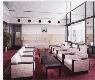
コーヒールラウンジ