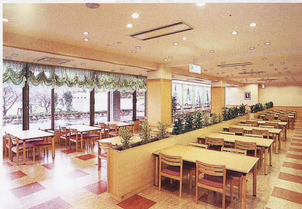
レストラン ゆかり