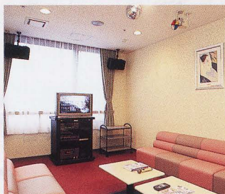
カラオケルーム(別館2F)