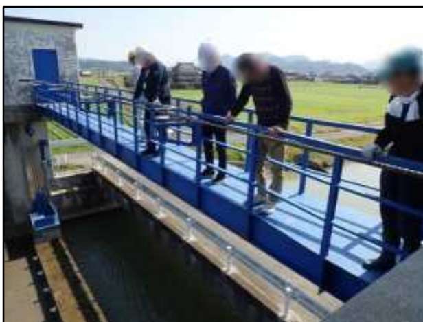
ゲート昇降動作確認