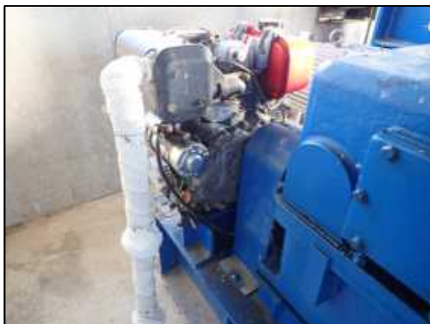
①ディーゼルエンジン オーバーホール

ストックマネジメントとは、「施設の機能診断に基づく機能保全対策の実施を通じて、既存施設の有効活用や長寿命を図り、LCC（ライフサイクルコスト）を低減するための技術体系及び管理手法」のこと