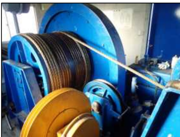
②ワイヤーロープ交換、グリスアップ