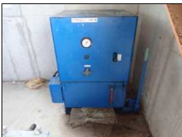
③オイルポンプ及び配管のオイル漏れ箇所修理