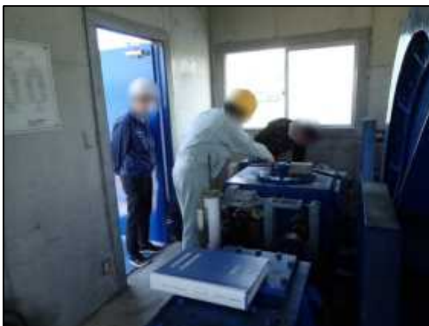
エンジン操作説明