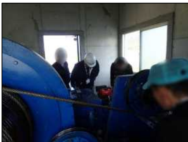
エンジン操作説明